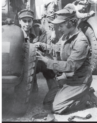
Elizabeth, II. Dünya Savaşı'nda eğitim amacıyla araç tekerleği değiştirirken (Nisan 1945)

Demokrasi demişken... Demokrasinin ilk örnekleri antik Yunan şehir devletlerinde görülmüş olsa da bu anlayış geliştirilememiştir ve dünyanın diğer