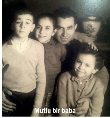
Mutlu bir baba