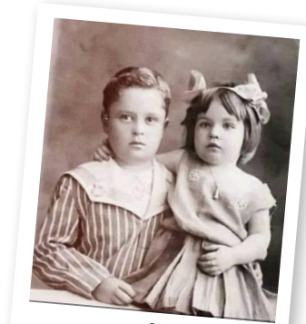
Nazım Hikmet kız kardeşi Melda ile

Not: Haziran sayımızda "Pekinel Kardeşler" ile gerçekleştirdiğimiz söyleşide, soyadları sehven "Pekiner" olarak basılmıştır, "Pekinel" olarak düzeltilir, özür dileriz.